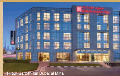
Hilton Garden Inn Dubai al Mina

Náš názor: velmi kvalitní hotel s perfektní polohou pro poznávání Dubaje uspokojí představy i náročnějších hostů.