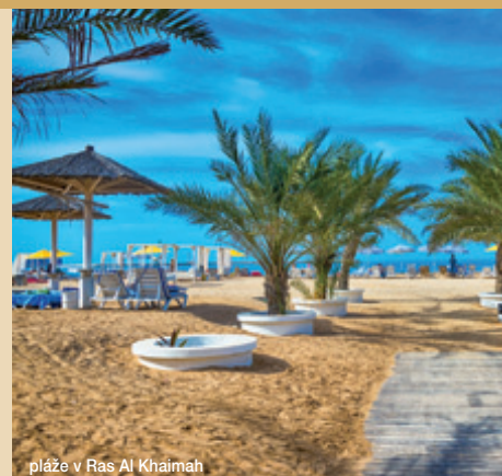
pláže v Ras Al Khaimah