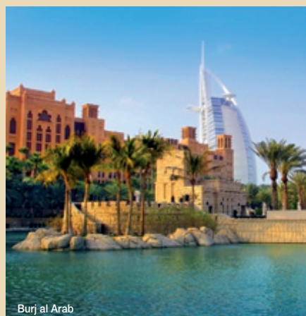
Burj al Arab