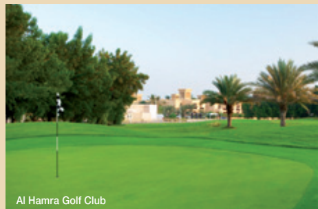
Al Hamra Golf Club

standardní balíček programu + navíc přeprava golfového bagu (1 ks do váhy max. 20 kg - celkem tedy bude možné přepravit odbavené zavazadlo 1 ks do 20 kg + golf bag do 20 kg), 1x Tee time na 18-ti jamkové hřiště (neděle až čtvrtek, pátek a sobota za příplatek 16,- USD).