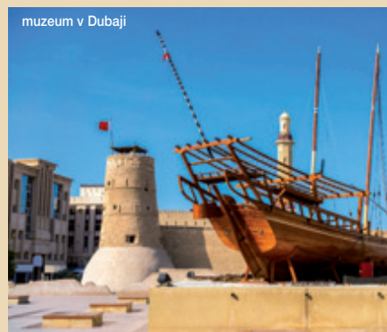
múzeum v Dubaji