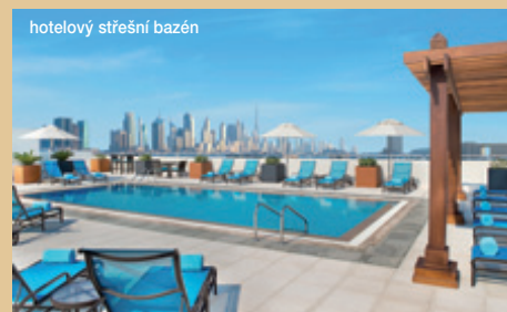
hotelový střešní bazén